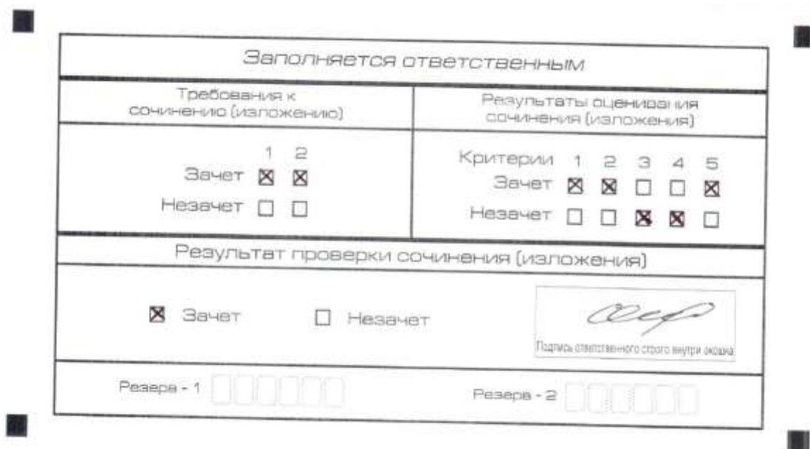
Рис. 8. Область для оценки работы

3. Во всех остальных случаях сочинение (изложение) проверяется по всем пяти критериям и оценивается по системе «зачет»/«незачет» (например, нельзя не проверять работу по критериям К4 и К5, если выпускник получил зачет на основании зачетов по критериям К1, К2, К3).