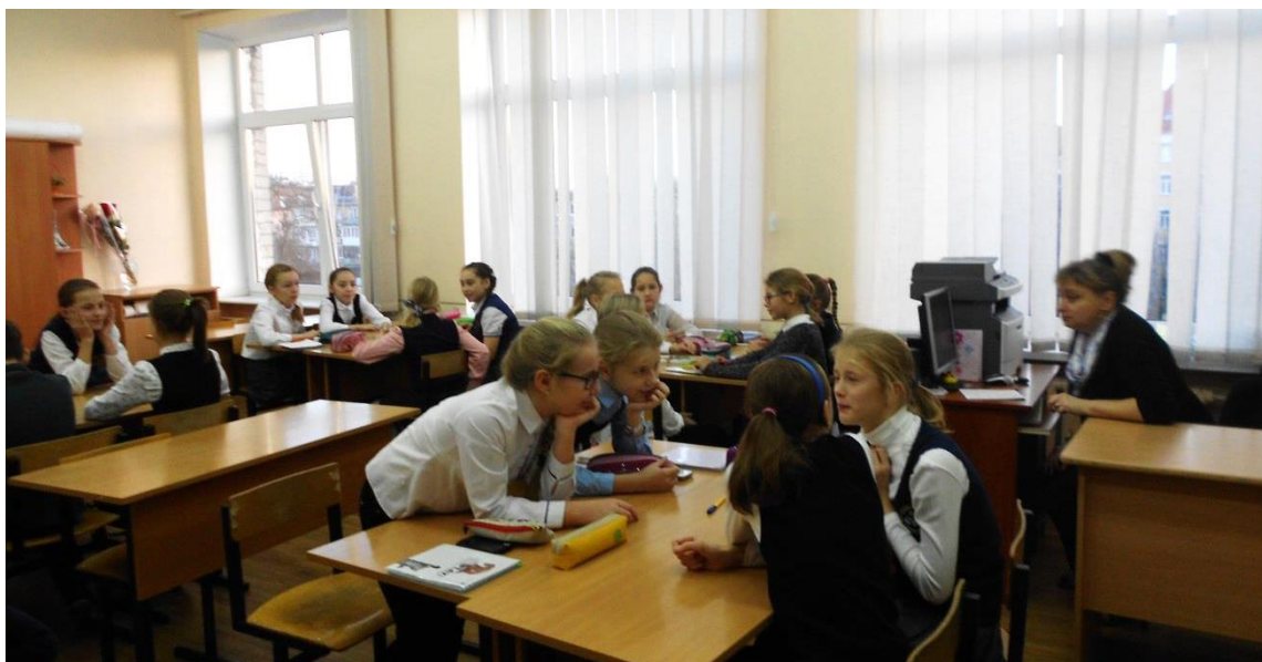
Обсуждение тем проектов в группах