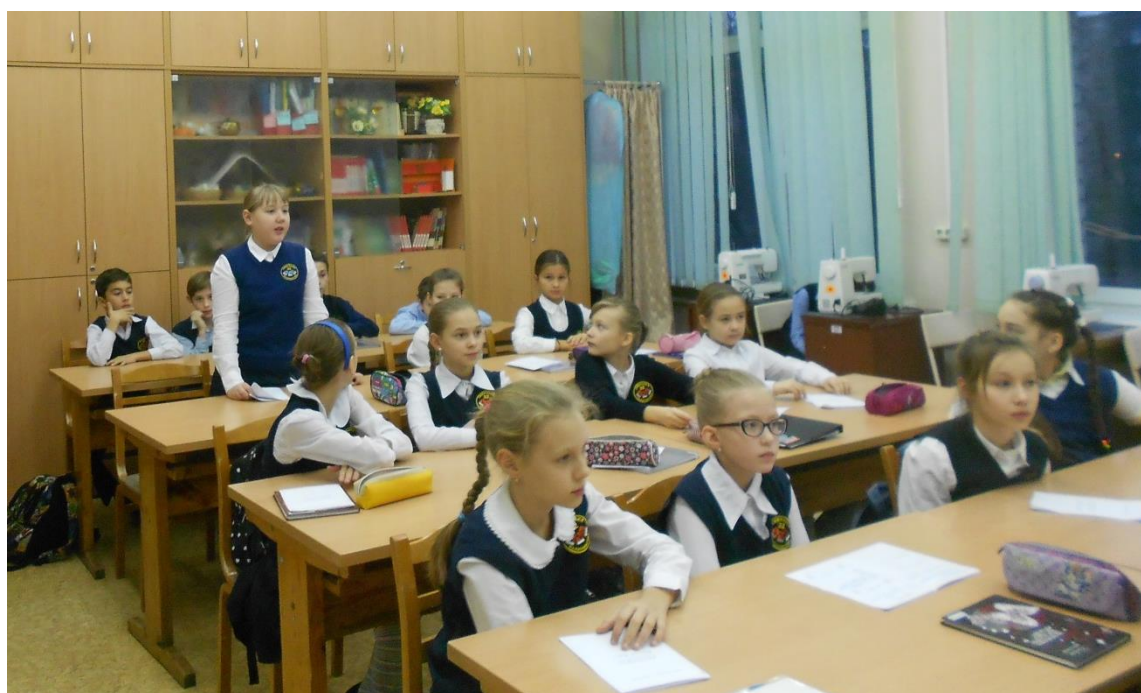
Защита темы проекта «Почему я решил работать над этой темой»