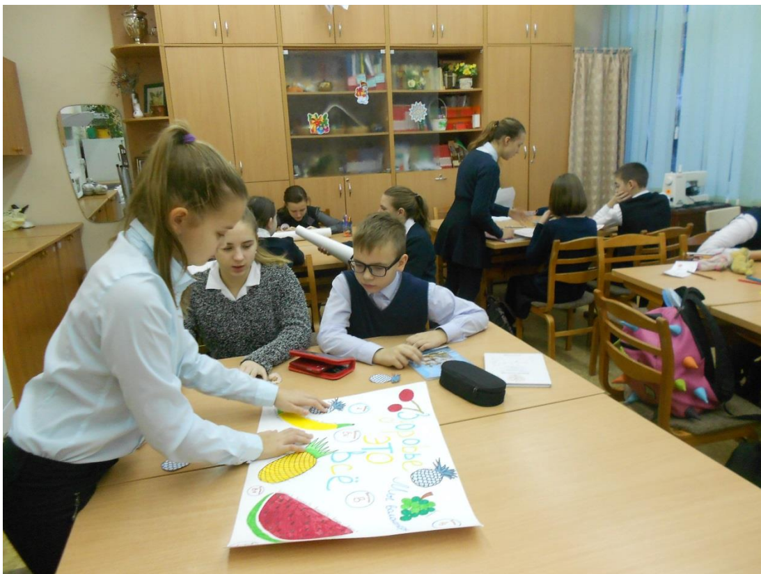
Подготовка к защите темы проекта